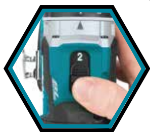
2-Gang-Getriebe mit Schlag.