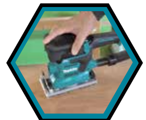
Schwingschleifer mit eingebautem Staubabsaugsystem.