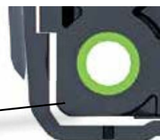
Struktur zur Stossdämpfung