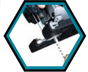
Mit werkzeuglosem Blattwechsel.