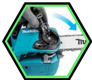
Kettenwechsel und Kette Anziehen ohne Werkzeug.