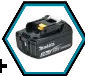
1x Akku 3.0 Ah (Art. 632G12-3)