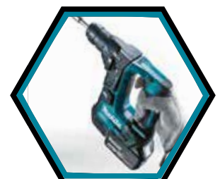
Kompakte, ergonomische und leichte Maschine.